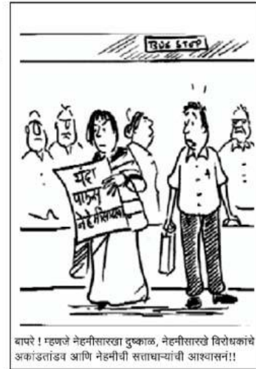
बापरे ! म्हणजे नेहमीसारखा दुष्काळ, नेहमीसारखे विरोधकांचे अकांडतांडव आणि नेहमीची सत्ताधऱ्यांची आश्वासने!!