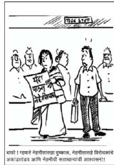
बापरे ! म्हणजे नेहमीसारखा दुष्काळ, नेहमीसारखे विरोधकांचे अकांडतांडव आणि नेहमीची सत्ताधऱ्यांची आश्वासने!!