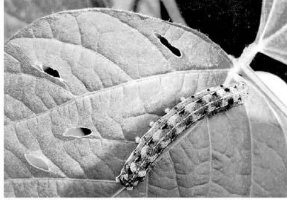
सोयाबीनची पाने खाणाऱ्या अळीमुळे शेतकऱ्यांचे मोठ्या प्रमाणात नुकसान होत आहे.

सध्या सुरू असलेल्या सर्वेक्षणानुसार सुमारे पंधरा हजार हेक्टर क्षेत्रात पाने खाणाऱ्या