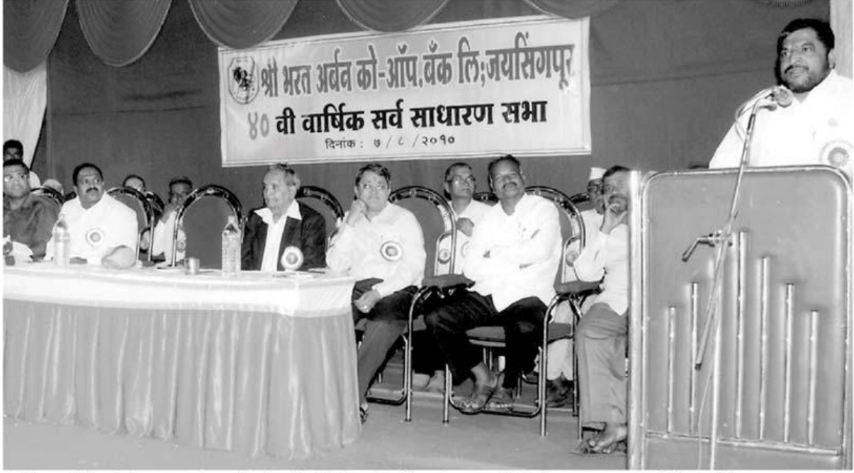
जयसिंगपूर : येथील भिर्डी सभागृहात भरत अर्बन को- ऑप. बँकेची ४० वी वार्षिक सर्वसाधारण सभेवेळी बोलताना खासदार राजू शेटी. व्यासपीठावर इतर मान्यवर.